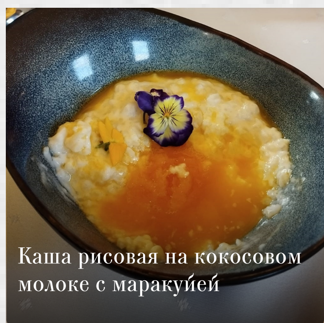
Каша рисовая на кокосовом молоке с маракуйей

Начните свой путь к здоровому образу жизни прямо сейчас, выбрав специальное меню!