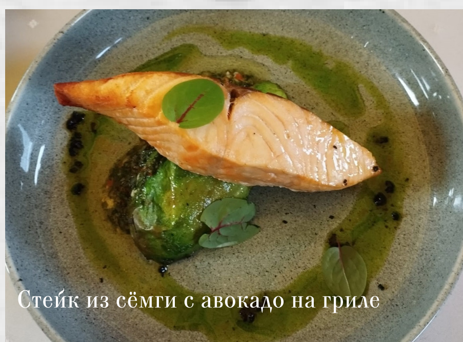
Стейк из сёмги с авокадо на гриле