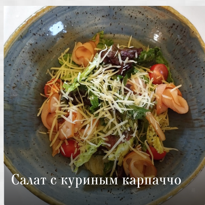
Салат с куриным карпаччо