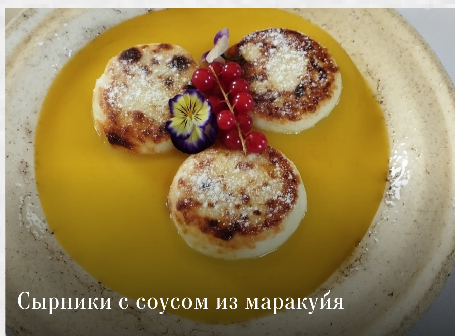
Сырники с соусом из маракуйя