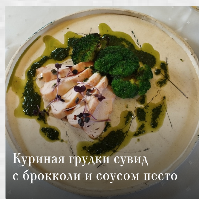
Куриная грудки сувид с брокколи и соусом песто