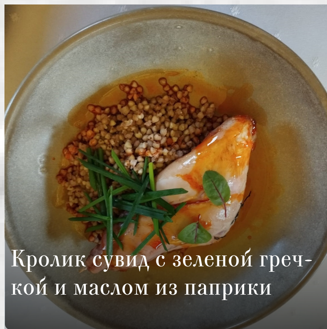
Кролик сувид с зеленой гречкой и маслом из паприки