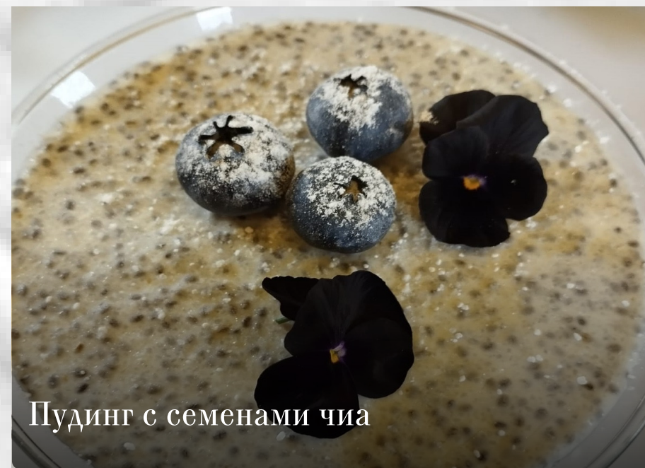
Пудинг с семенами чиа