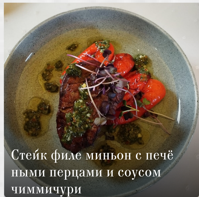
Стейк филе миньон с печеными перцами и соусом чиммичури